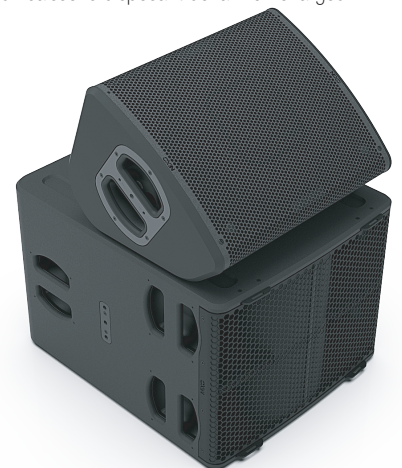
Une enceinte P12 sur un caisson L15 permet de bénéficier d'un retour de scène pour batterie extrêmement compact mais néanmoins efficace.

Une configuration de latence minimale dédiée, compatible avec les configurations de latence minimale de l'enceinte P12, est également disponible. Il est ainsi possible d'obtenir un système très efficace de retour de scène pour batterie, les deux caissons disposant de la même largeur.